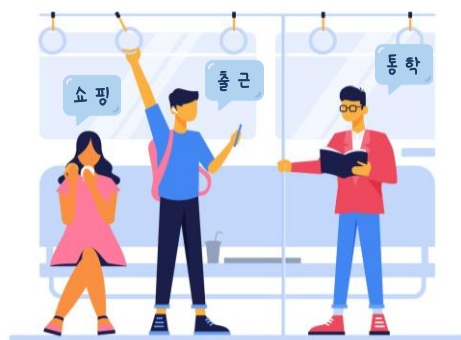
Illustration designed by Freepik

본 사업은 과학기술정보통신부가 주관하고 한국지능정보사회진흥원이 추진하는 사업으로, 대중교통 이용자 중심의 환승정보 기반 맞춤형 교통서비스 제공을 위해 인공지능 학습용 데이터를 구축하는 사업입니다.