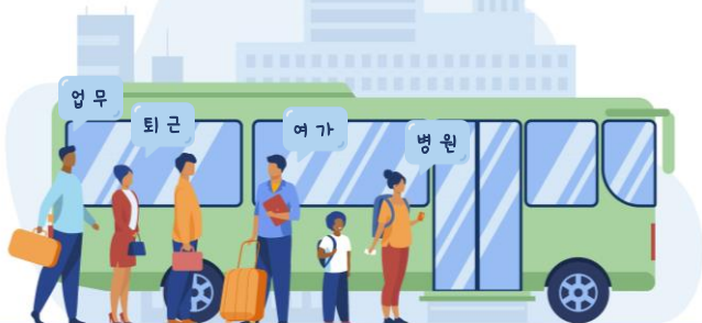
Illustration designed by Freepik