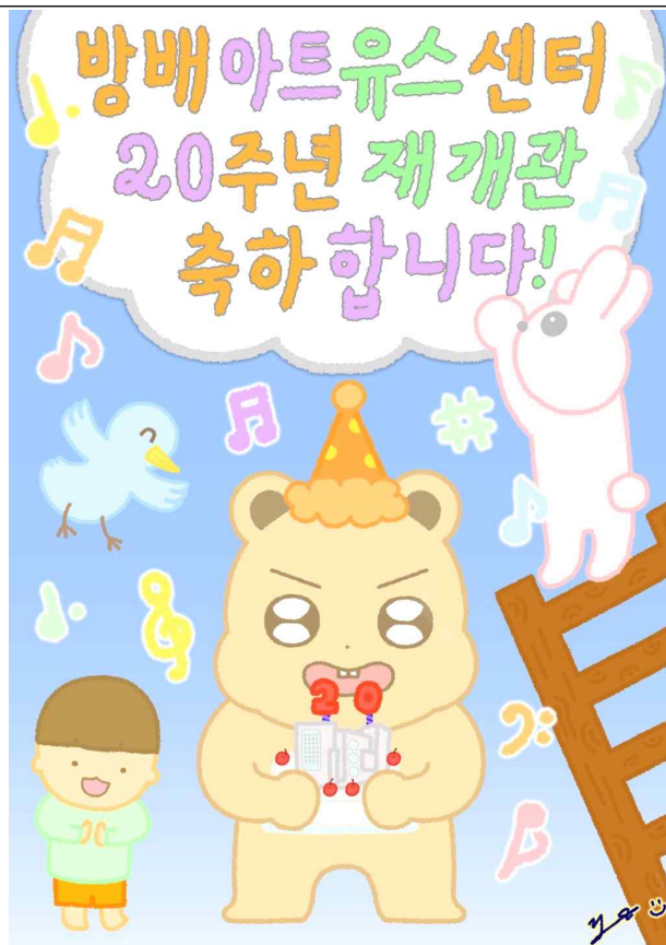
자유 부문 작품 참고 예시