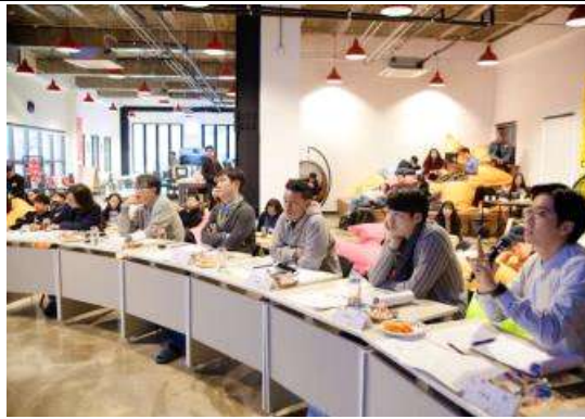
<전문가 심사 및 컨설팅>