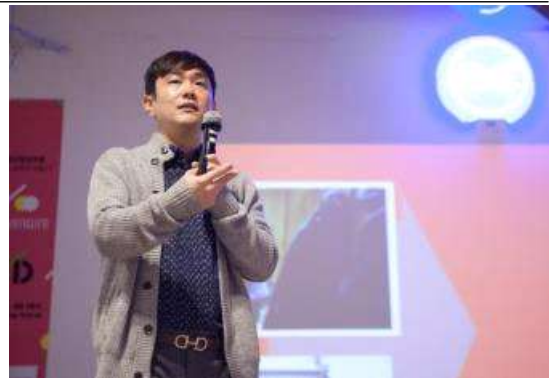
<특강 및 멘토링>