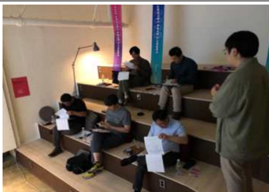
<특강 및 발표공유회>