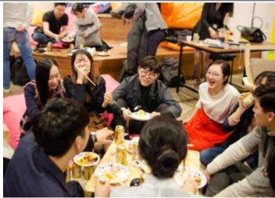
<지역분석 및 해석하기>