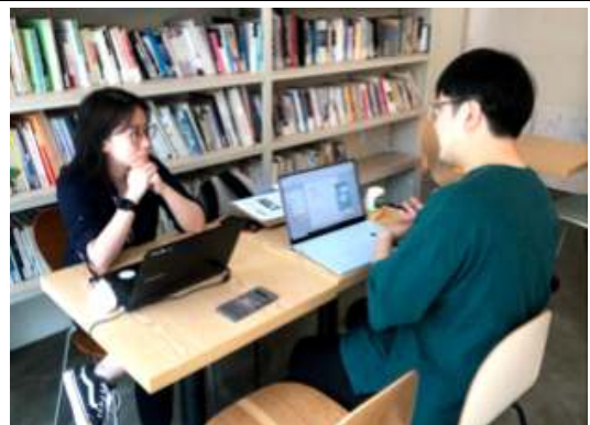
<협업제안 및 사회적 혁신가 발굴>